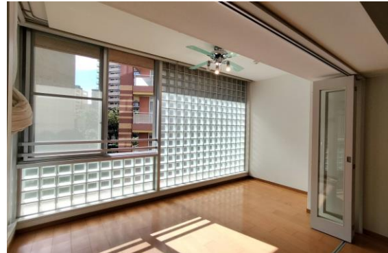
光あふれるサニーサイドリビング