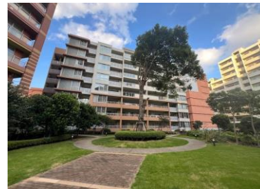
マンションの外観