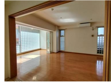
和室からリビングを撮影